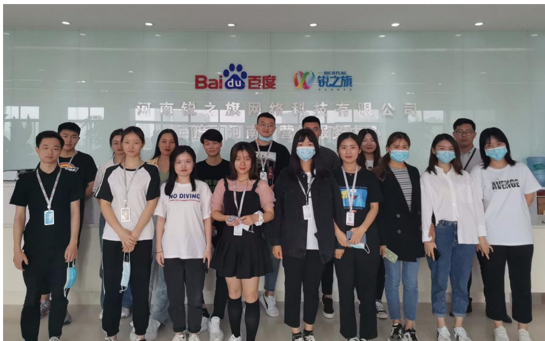
学生到校外实训基地开展顶岗实习