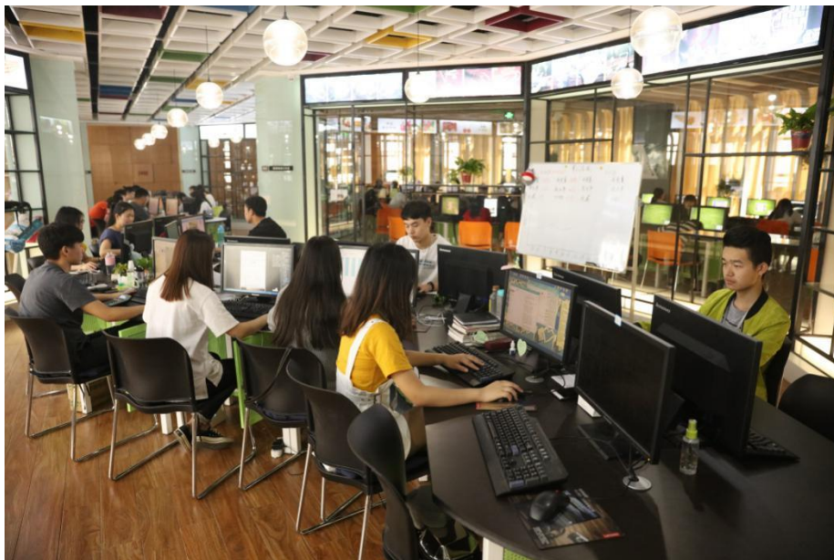
为创新创业学生提供全方位支持