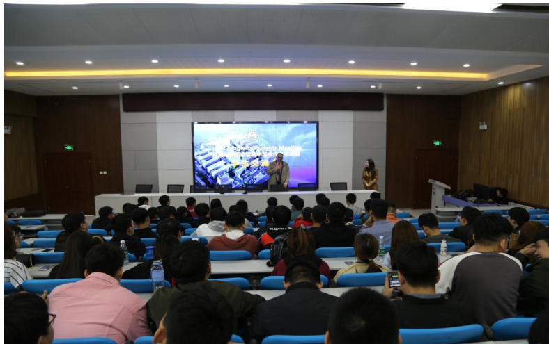
加拿大北方学院代表与学生交流