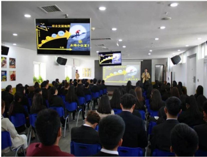
学生去合作企业进行专业岗位认知