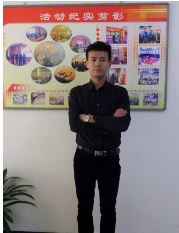
市场营销专业成功创业学生代表