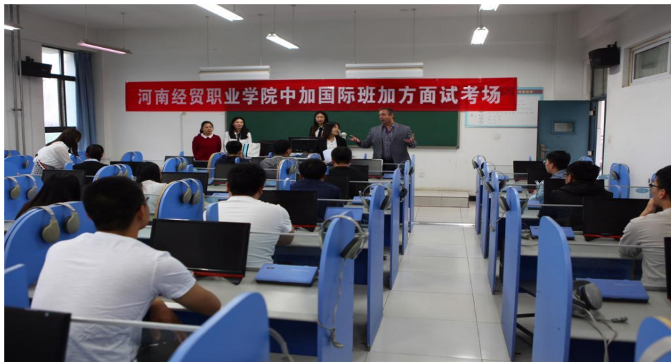
加拿大北方学院现场选拔出国学生