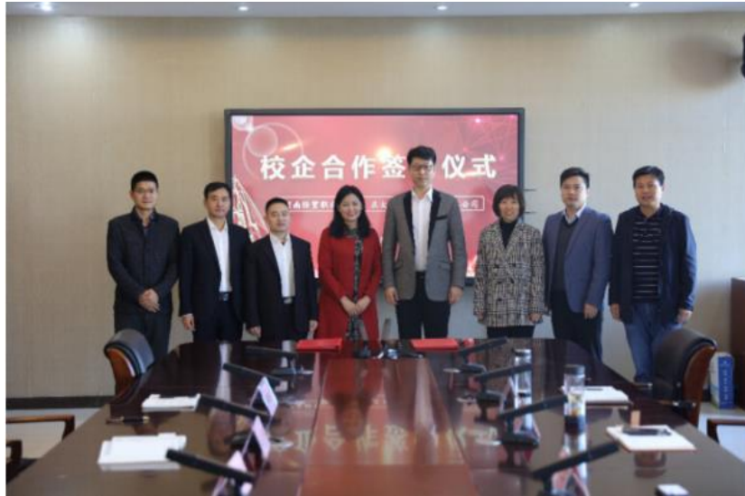
学院与正大集团签订校企合作协议书