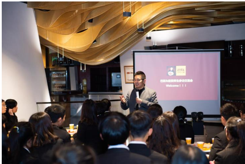
学生与企业高管面对面沟通交流