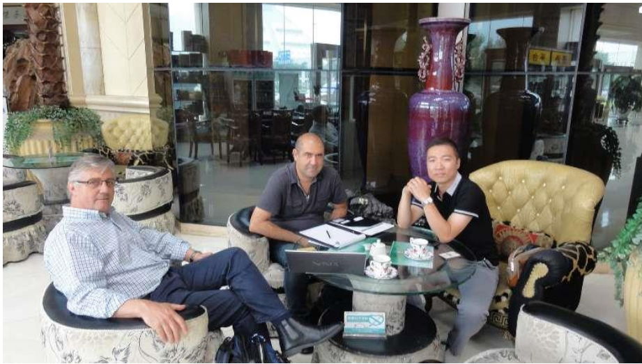
优秀毕业生与外商洽谈业务

学院牵头成立了“河南跨境电子商务综合实验区职业教育集团”、组织跨境电商高峰论坛，集团众多跨境电商企业为学生提供了充足的实习和就业机会。