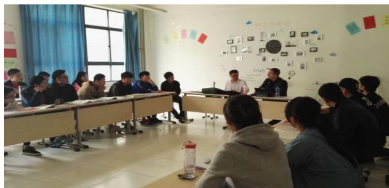
加方代表与学生交流相关课程学习