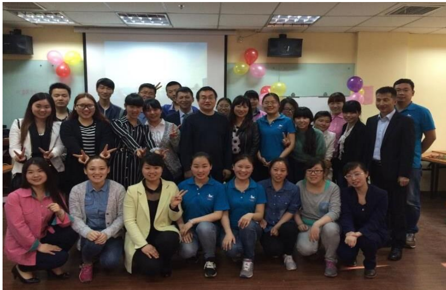
专业教师进行岗位实践教学跟踪