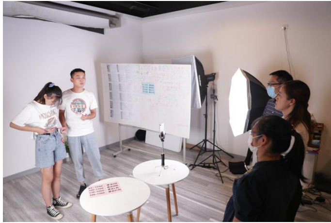
电商直播课堂教学