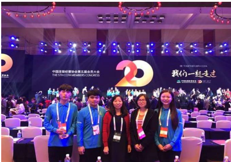
学生参加中国新零售大赛和新零售论坛活动