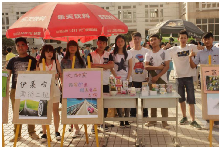
学生参加营销实践教学