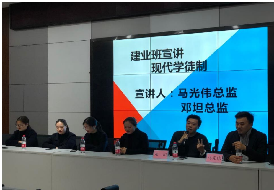
企业来校宣讲招生招聘