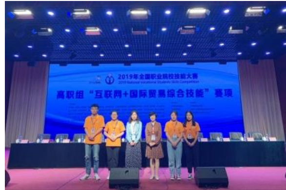
2019年全国职业院校技能大赛互联网+国际贸易综合技能赛项颁奖