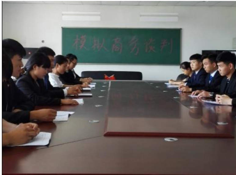
学生在实训室参加模拟实训教学