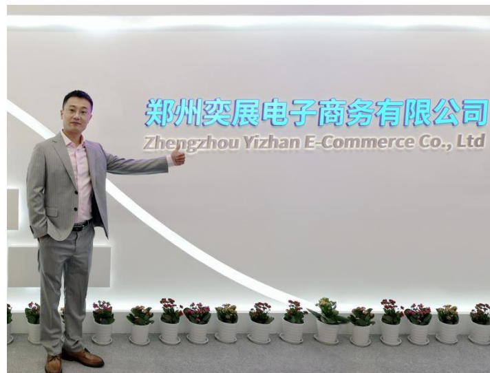
电子商务专业成功创业学生代表