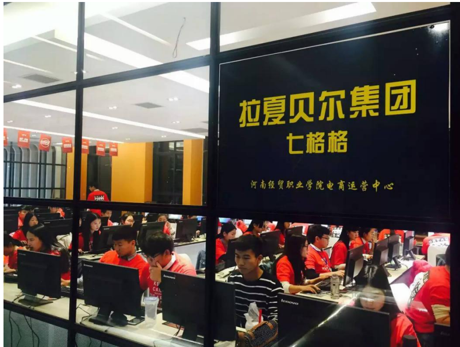
在企业项目实战中锤炼专业技能