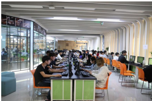
学生在进行跨境电子商务技能综合实训