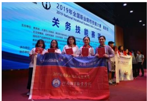
2019年全国职业院校技能大赛关务技能赛项颁奖