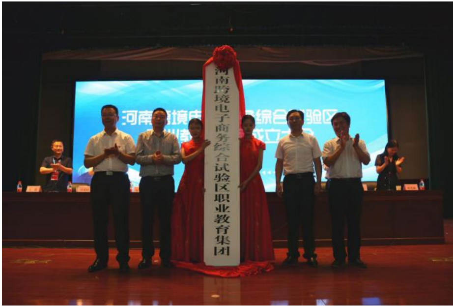
河南跨境电子商务综合试验区职业教育集团成立