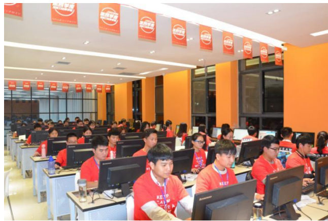
实战项目进课堂，体验“双十一”