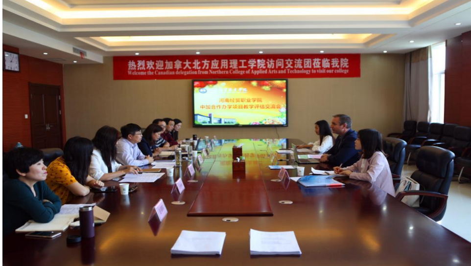
加方代表来我校访问交流

员)；也可选择进一步去加拿大北方理工学院完成学业，通过技术移民留在加拿大从事市场营销的销售、策划和管理等工作等。