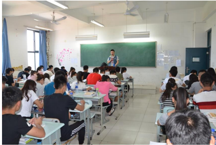
专任老师进行课堂教学