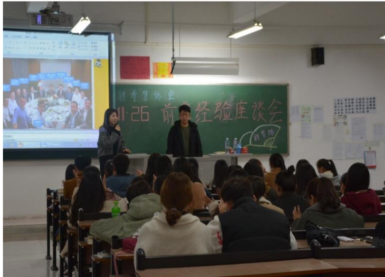
新零售协会进行社团活动