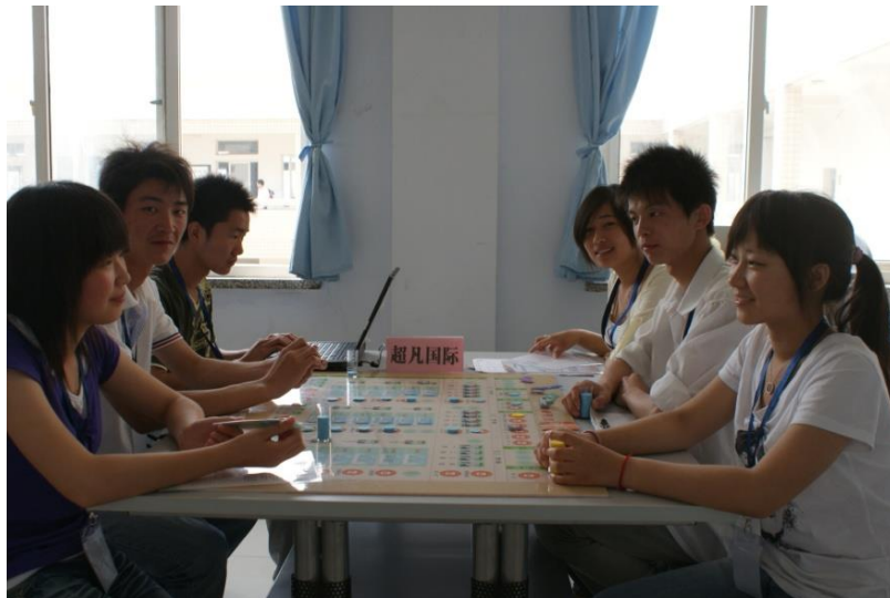
连锁经营管理专业实训教学