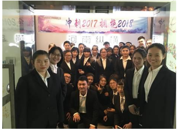
河南纵横国际进出口有限公司实践教学活