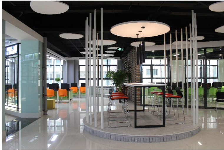
校内国家级电子商务实训基地实景