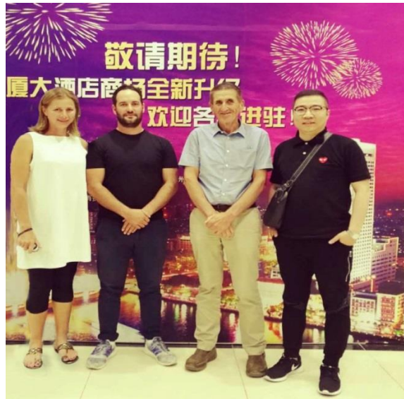
优秀毕业生在进出口交易会上与外商洽谈