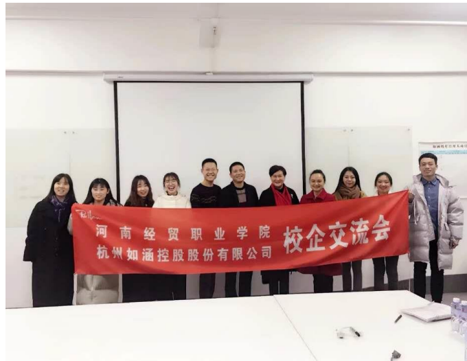
校企协同双元育人